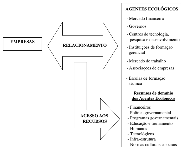
Figura 02 – Acesso a recursos a partir do relacionamento das empresas com agentes de apoio