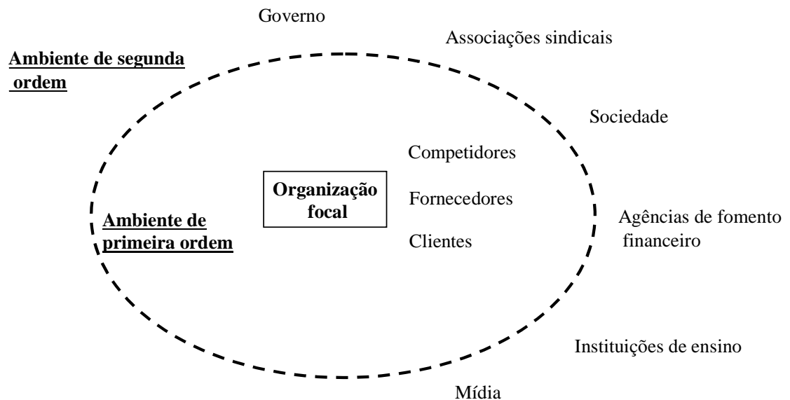
Figura 1 – Perspectiva de ambiente organizacional Elaborada pelos autores, a partir da perspectiva de Emery e Trist (1965).

A figura que se segue visualiza a perspectiva de ambiente organizacional – de primeira e segunda ordem – de Emery e Trist (1965).